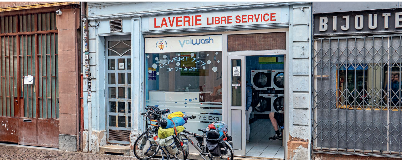
Wäscherei in Strassburg.