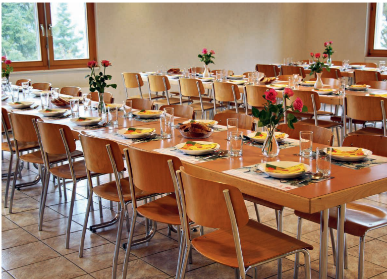
Jung und Alt trafen sich zum traditionellen Suppenzmittag.

Am Sonntag, 5. März, hat die Missionsgruppe zum traditionellen Suppenzmittag eingeladen. Nach dem Gottesdienst in der Pfarrkirche sind