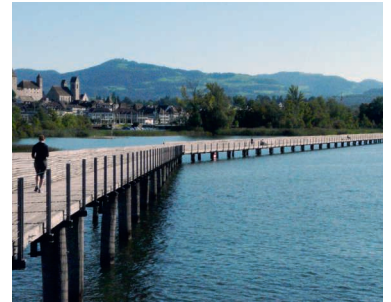
Die Wanderungen führen durch die Region Zürichsee. Im Bild: Pilgersteg bei Rapperswil.