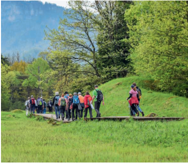
Ein Gemeinschaftserlebnis: auf der Fuss- und der Velowallfahrt 2022.