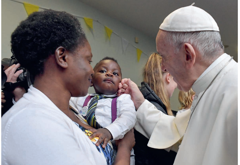
Papst Franziskus stellt Ausgegrenzte ins Zentrum: Besuch in einem Heim für Obdachlose und bedürftige Familien in Dublin (2018).

Friedensgesten: Bei seiner Heiliglandreise im Mai 2014 nach Jordanien, Israel und in die Palästinensergebiete wirbt Franziskus für Versöhnung im Nahostkonflikt. Er setzt spektakuläre Friedensgesten, etwa ein Gebet an der israelischen Sperrmauer