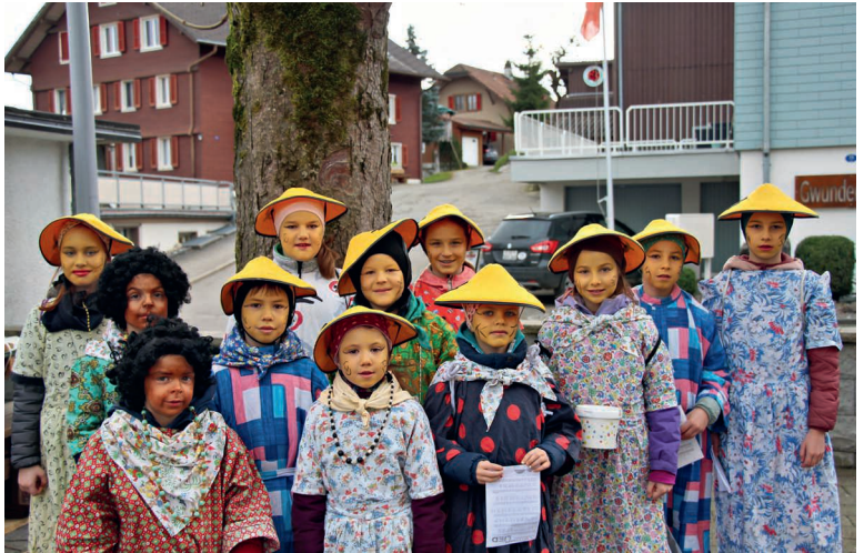
Die Missionskinder gehen von Haus zu Haus und sammeln Spendengelder.

Gut gelaunt trafen sich die zwölf Kinder am Morgen des Fasnachtsfreitags im Saal vom Hotel Kreuz zum